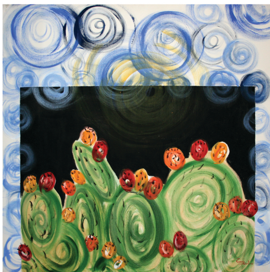
Fichi d'India tecnica mista su tela - cm 70 x 70