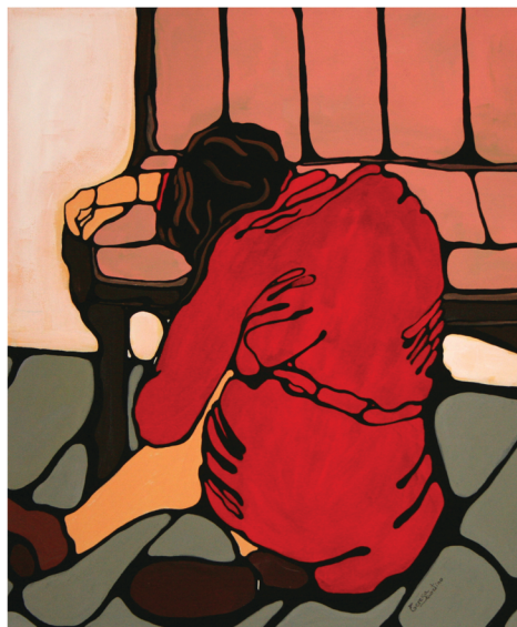
"La donna piangente" - acrilico su tela - cm 50 x 60

La sua presenza è percettibile nel gesto, nel lirismo sincero, nel colore.