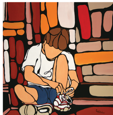
"Andrea si allaccia le scarpe" acrilico su tela cm 70 x 70