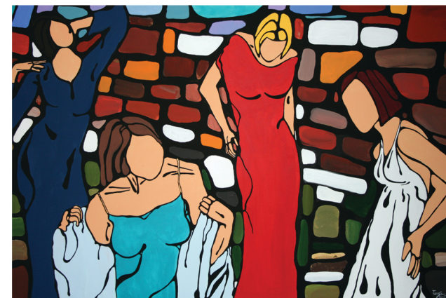
"Alto borgo" - acrilico su tela - cm 100 x 70